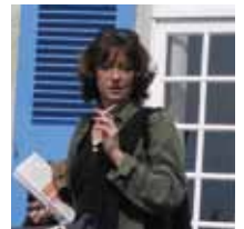
باسكال لو ثوريل

ولد الشاعر والكاتب، في سامسون، لاديك، تركيا عام 1959. درس الأدب العربي واللاهوت في الرياض في جامعة محمد بن سعود الإسلامية. نشرت أولى قصائده عام 1982، واستمر في نشر القصائد والقصص والمقالات منذ ذلك الحين. وعلى مدى السنوات الخمس عشرة الماضية قام بتدريس الكتابة الإبداعية في المنظمات في جميع أنحاء اسطنبول. أورال نائب رئيس تجمع المؤلفين الأتراك، وعضو في مجلس إدارة مرجعية مساح المدينة، ويشغل منصباً في مجلس إدارة مهرجان اسطنبول الدولي للشعر. وكان المنسق العام لمهرجان اسطنبول الأدبي الافتتاحي عام 2009 وللمرة الثانية عام 2010.